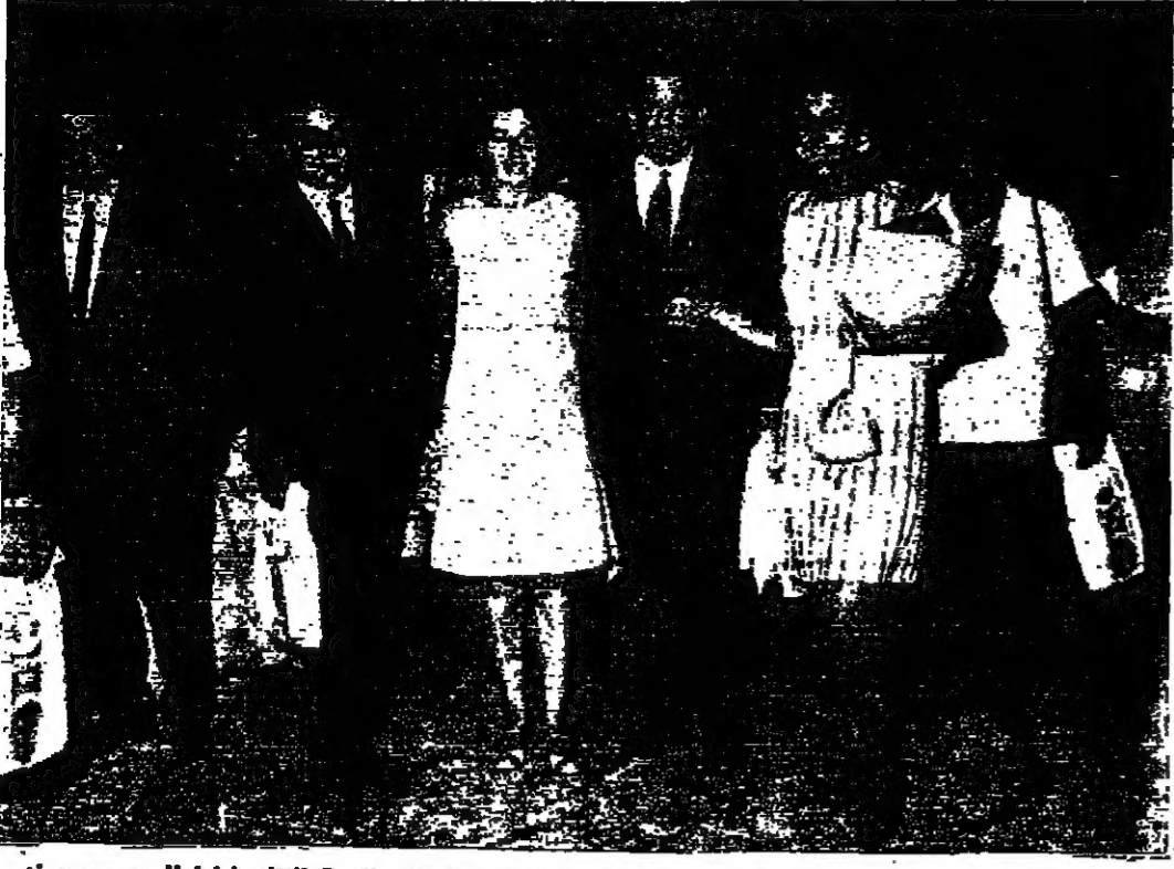
الوفد السياحي القبرصي لدى وصوله الى مطار عمان في ضيافة مؤسسة خيرية بمناسبة افتتاح خطها الجديد بين عمان وقبرص